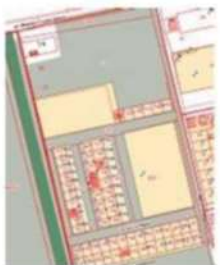
Схема расположения элемента планировочной структуры

Приложение к Решению Городской Думы от №